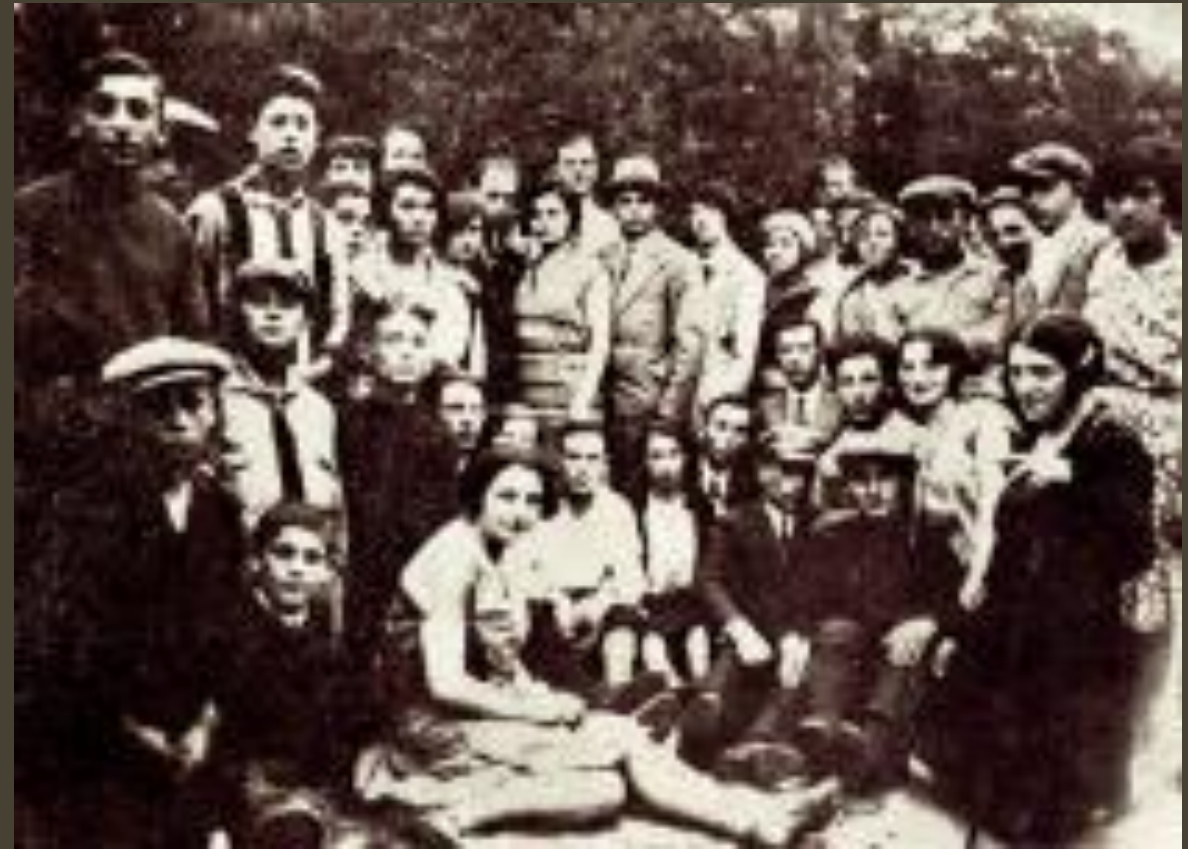
prezentacja przygotowana przez : Aleksandrę Koziół Klasa V B Szkoła Podstawowa nr 2 im. Księcia Janusza – w Górze Kalwarii