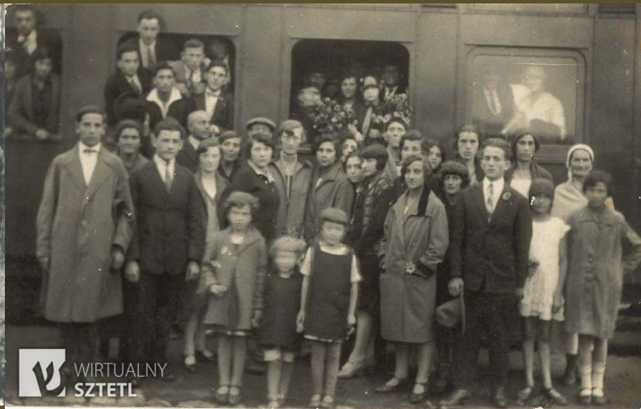
Żydzi z Góry Kalwarii.