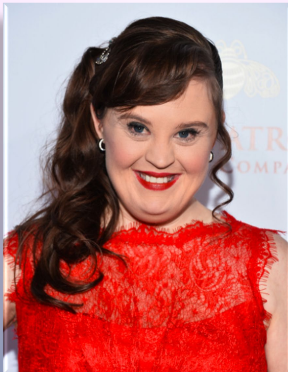
Jamie Brewer , aktorka i modelka. W lutym 2015 r. jako pierwsza kobieta z Zespołem Downa wzięła udział w nowojorskim tygodniu mody.