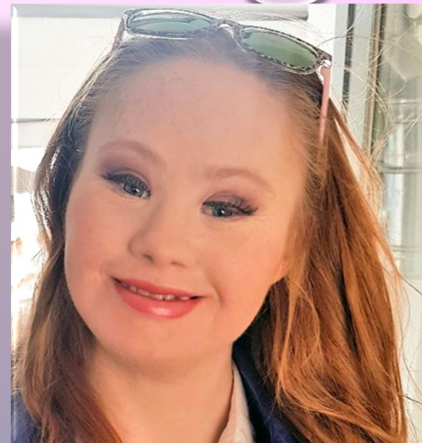
Madeline Stuart , australijska supermodelka Regularnie bierze udział w pokazach mody na całym świecie. Angażuje się w walkę o prawa dla osób wykluczonych. Stworzyła własną kolekcję ubrań.