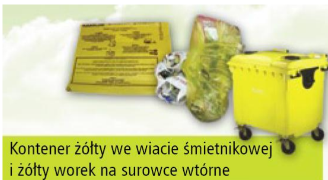
Kontener żółty we wiacie śmietnikowej i żółty worek na surowce wtórne